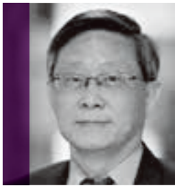
清華大學校長 賀陳弘